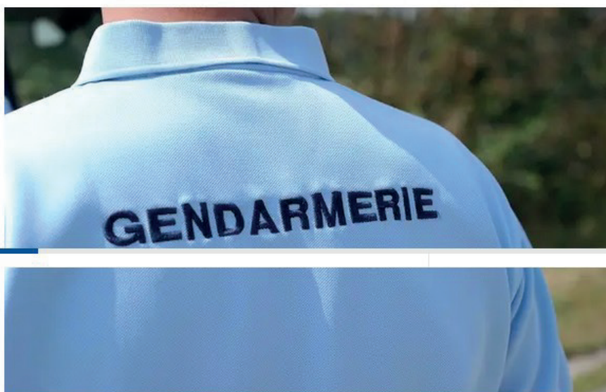
Illustration d'un gendarme.