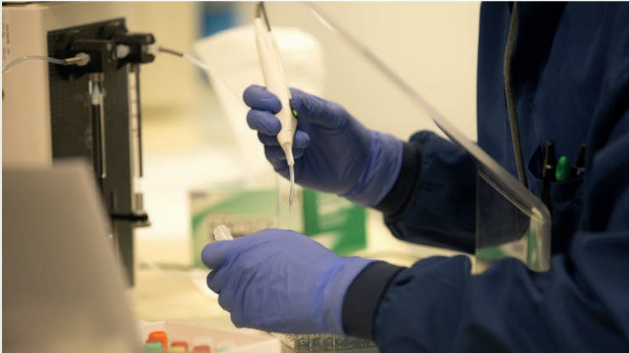
June Almeida a développé des méthodes pionnières d'imagerie virologique.