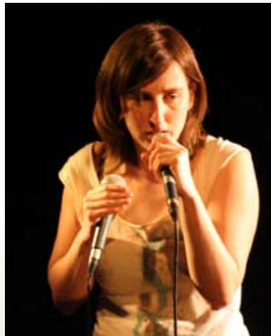
Resistenz

L ES JOUTES VERBALES, ancêtres des battles hip-hop, n'ont pas vu le jour dans les ghettos américains. Elles existaient déjà sur les plateaux de Kabylie, mais se retrouvent aussi dans les emboladores rythmiques de Salvador de Bahia. C'est dans ces dernières que les toulousains de Fabulous Trobadors ont puisé leur scansion -mâtinée de façon ludique à la tradition occitane. En effet, les frontières entre les genres sont poreuses : Abd Al Malik, lui, se voit comme une sorte de sampler humain, et dit avoir associé pour Gibraltar sa culture hip-hop, le jazz, un peu de chanson, beaucoup de slam. Celui-ci trouve aussi origine dans d'autres joutes verbales, celles des pénitenciers, que Marc Smith, inventeur du genre, fréquenta un temps. Champion de France de la discipline, le Grandiloquent Moustache Poésie Club dépeint le slammeur : « Nouvel empereur des mots / César des césures / Kaiser des cassures / Tsar star des stances / Qui met le feu dans l'assistance ».