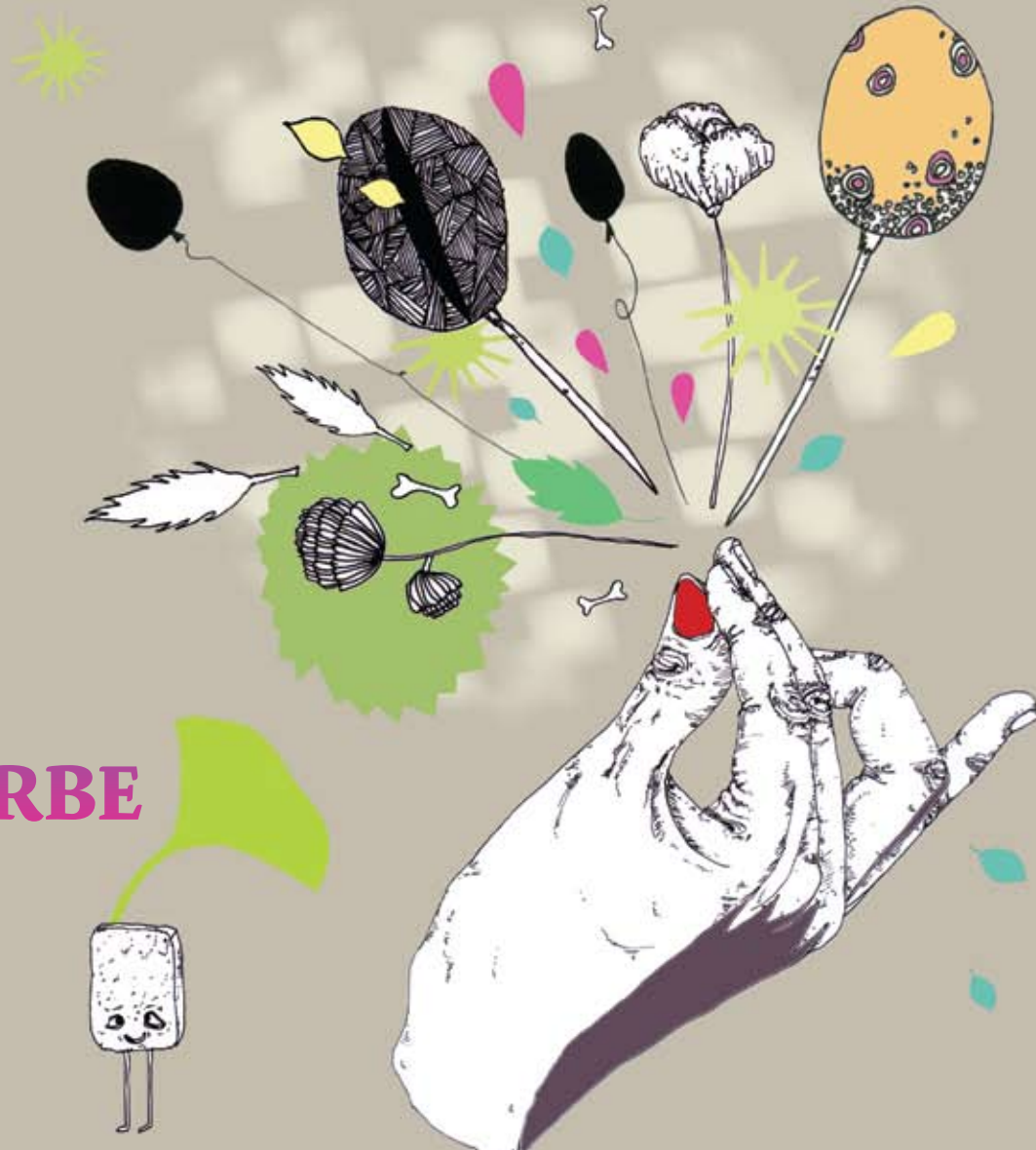
Illustration : Mylène Montandon-Varoda & Charlotte Hardy. www.labelleecole.org